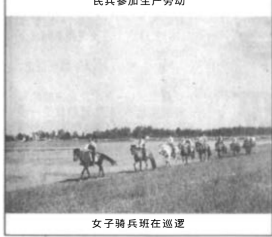
女子骑兵班在巡逻