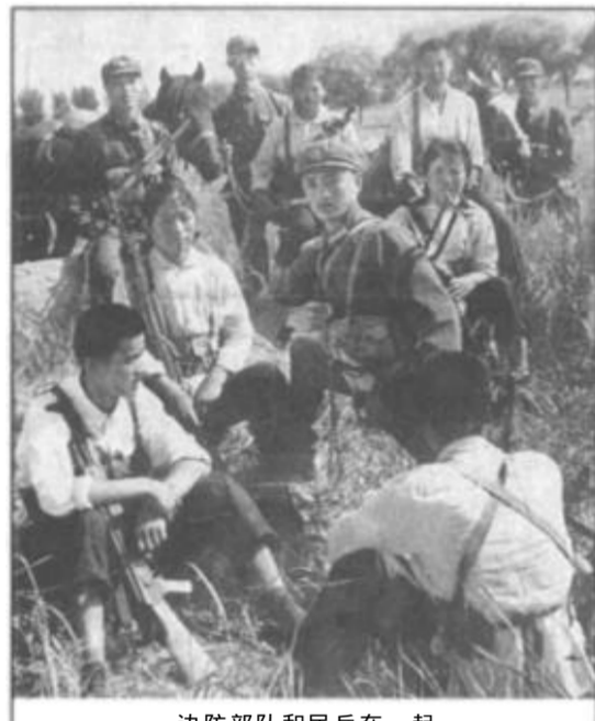
边防部队和民兵在一起