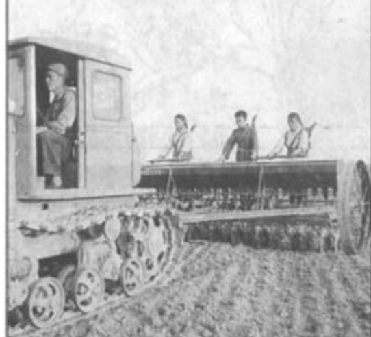
民兵参加生产劳动